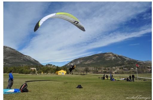
L'atterrissage principal, grand et toutes orientations