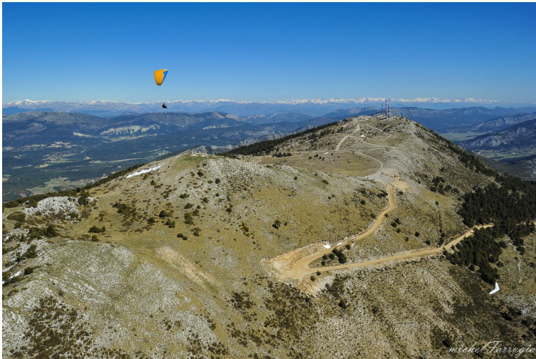
En vol côté S-O. Au fond les Alpes et le Mercantour

Le site de vol du Lachens est un endroit idéal pour l'enseignement. L'UCPA s'est installé sur place et l'école Parapente Lachens pratique assidûment l'endroit.