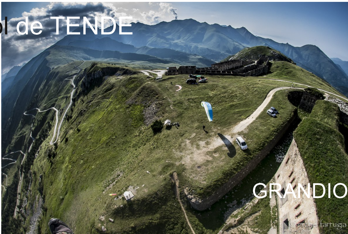
Le décollage coté sud